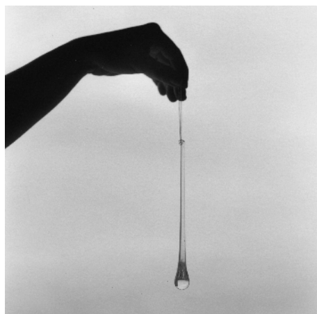
Israël Ariño, Sans nom, série Atlas, 2011

Site internet : http://www.israelarino.com/